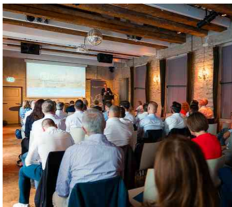
Real Estate Summit WOHNEN: The Grand