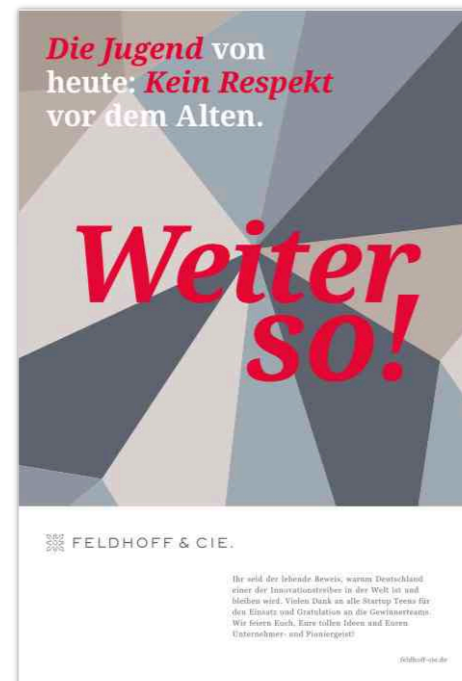
Unsere Anzeige in der WELT-Sonderausgabe zu STARTUP TEENS (August 2022)